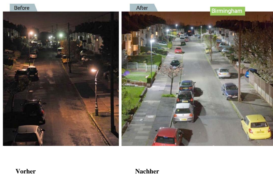
Bild 1: Das Ergebnis des LED-Einsatzes in Birmingham