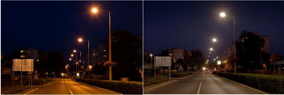
Bild 3: Die Kaszap-Straße, Ersetzen von HPS durch LED